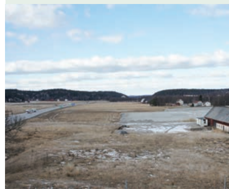
Lägen för verksamheter med behov av vägtransporter är i planen föreslagna nära väg E6 i Skee.