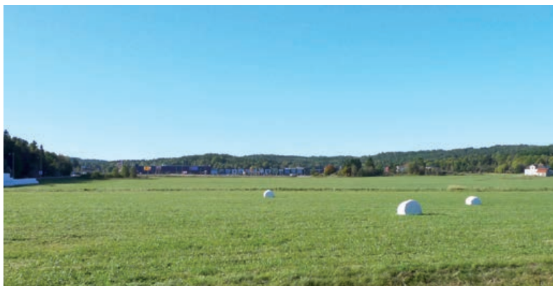
Landskapsavschnitt i Nordby med Nordby köpcentrum i bakgrunden

Nya handels- eller industriområden kan komma att bli aktuella i områden där riskfrågor måste belysas t ex risk för bullerstörningar, översvämningssrisker och risker med förorenad mark. Ett exempel är risk för höga vattenstånd i planerat verksamhetsområde i Bastekärr söder om Skee.