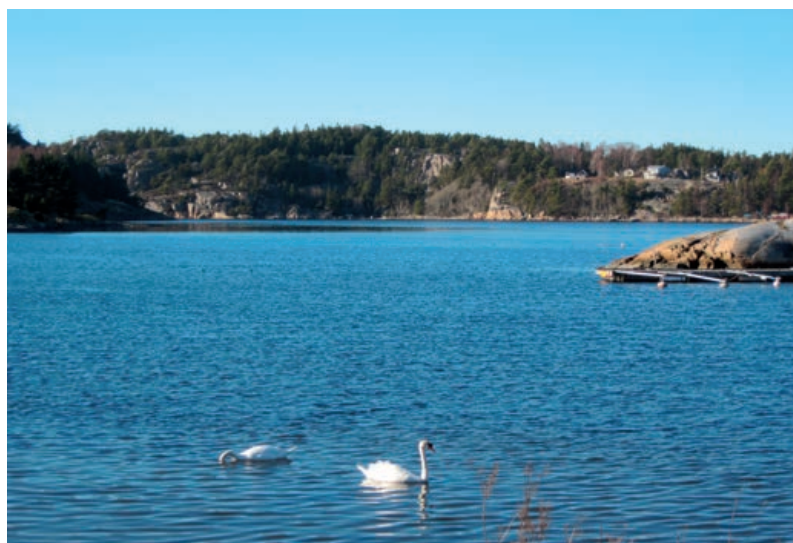
Vy norrut över Dynekilen från Hällestrand