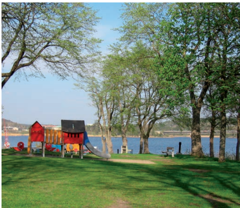
Kärleksudden vid Strömsvattnet i Strömstad

Om en förbättring av kollektivtrafiken sker, vilket kan bli följden av att fler arbetsplatser tillkommer inom handel i Skee och Nordby, kan det gynna förhållanden där familjemedlemmar arbetar inom olika områden och får tillgång till en vidare arbetsmarknad inom kommunen.