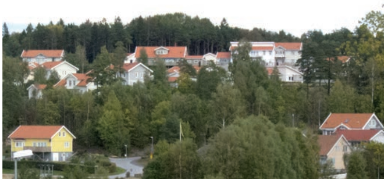
Bostadsbebyggelse i Ånneröd, norr om Strömstad

En närmare beskrivning av miljökonsekvenserna kan bli aktuell vid ändring av gällande planer för fritidsbebyggelse. Vid omvandling av befintlig bebyggelse i kustområdena till åretruntboende kan ordnat avlopp ge positiva miljöeffekter genom förbättrad vattenkvalité.