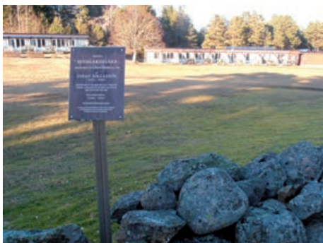
En rik natur- och kulturmiljö är en tillgång vid utveckling av besöksnäringen i kommunen.