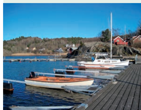
Småbåtshamn i Hällestrand