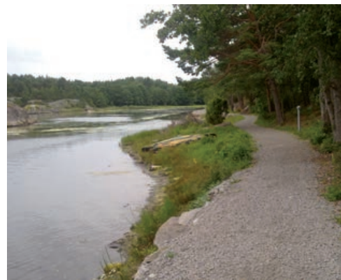
Öddö, tillgänglighet till strandområdet är här säkerställt i en detaljplan.

Läget nära Norge gör att kommunen under många år påverkats starkt av efterfrågan från den norska marknaden. Bland annat märks detta genom stor efterfrågan på handel, fritidshus och båtplatser men även genom att norska intressenter investerar i mark och fastigheter för att etablera verksamheter i kommunen. För näringslivet har det inneburit en kraftig ekonomisk tillväxt. Kommunen får skatteintäkter genom fler boende men också utgifter till följd av ökat behov av samhällsservice. Detta förhållande kvarstår sannolikt och understryker behovet av att den översiktliga planeringen kan användas som stöd för de beslut kommunen behöver fatta.