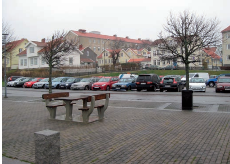
Stadsmiljö vid Västra Hamngatan i Strömstad, med äldre bebyggelse i bakgrunden

Med de förväntningar som ställs på att staden ska växa behöver det finnas en samlad bild och ett samlat förhållningssätt till stadsmiljön. Under förutsättning att planeringen fortsätter enligt intentionerna i ÖP-förslaget kommer detta att hanteras i fortsatt arbete med den fördjupade översiktsplanen för Strömstad - Skee. Stadsmiljöplanen är enbart vägledande och kulturhistoriska värden i stadskärnan behöver därför säkerställas vid detaljplaneläggning.