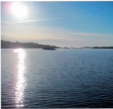
Vy mot havet i väster från Dynekilen

Enligt bestämmelser i miljöbalken och plan- och bygglagen ska en plan miljöbedömas om det finns risk för att genomförandet av planen kan antas innebära betydande miljöpåverkan. Det innebär i allmänhet att en översiktsplan ska genomgå en miljöbedömning. Miljöbedömningen är en hel process i vilken ingår att ta fram en miljökonsekvensbeskrivning (MKB). Tanken är att miljöbedömningen ska integreras i planar-