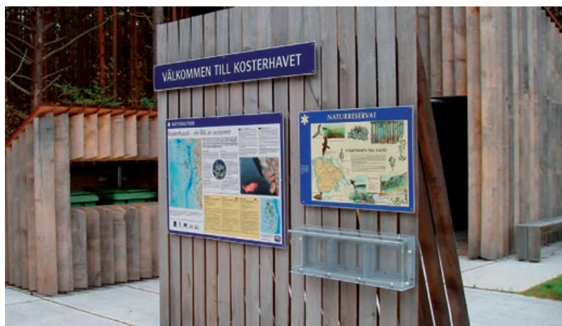
Entré på Saltö till nationalparken

Planen är inriktad mot bevarande av värdefull natur och mot tillgänglighet för det rörliga friluftslivet och en sammanhängande bild av den blågröna strukturen (hav, sjöar och skogsområden) är redovisad.