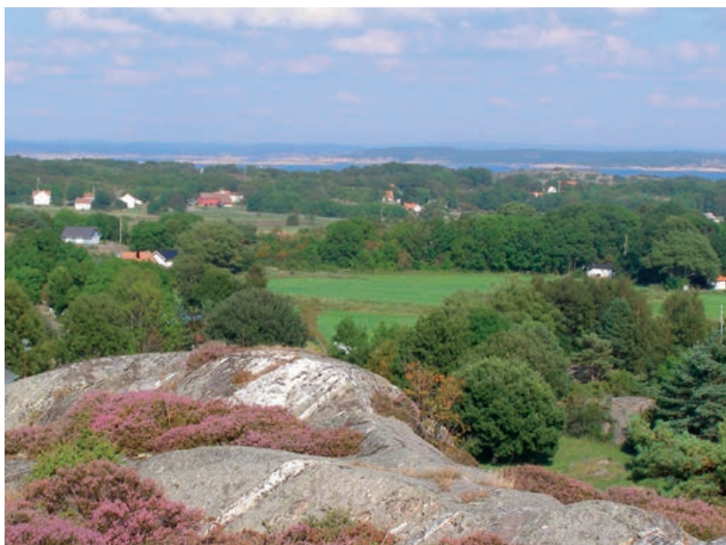
Vy mot fastlandet från Sydoster