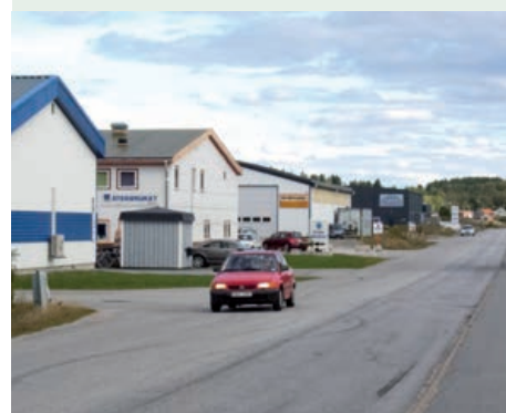
Erlanderöds industriområde i Strömstad