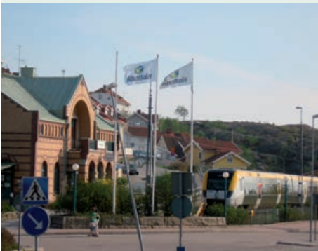
Bohusbanan med station i Strömstad

En stor del av kommunens utveckling har skett utifrån goda hamnlägen vid havet och Idefjorden samt båt- och vägförbindelserna till Norge och europavägen söderut genom Bohuslän. Utvecklingen av boende, turism, handel och övrigt näringsliv medför krav på förbättrad infrastruktur och goda kommunikationer. De senaste decennierna har en kraftig ökning av både bil- och båttrafik medfört ökade utsläpp och störningar. Förbättrad kollektivtrafik och bättre förutsättningar för lokal gång- och cykeltrafik kan inte lösas, men får stöd, i den översiktliga planeringen.