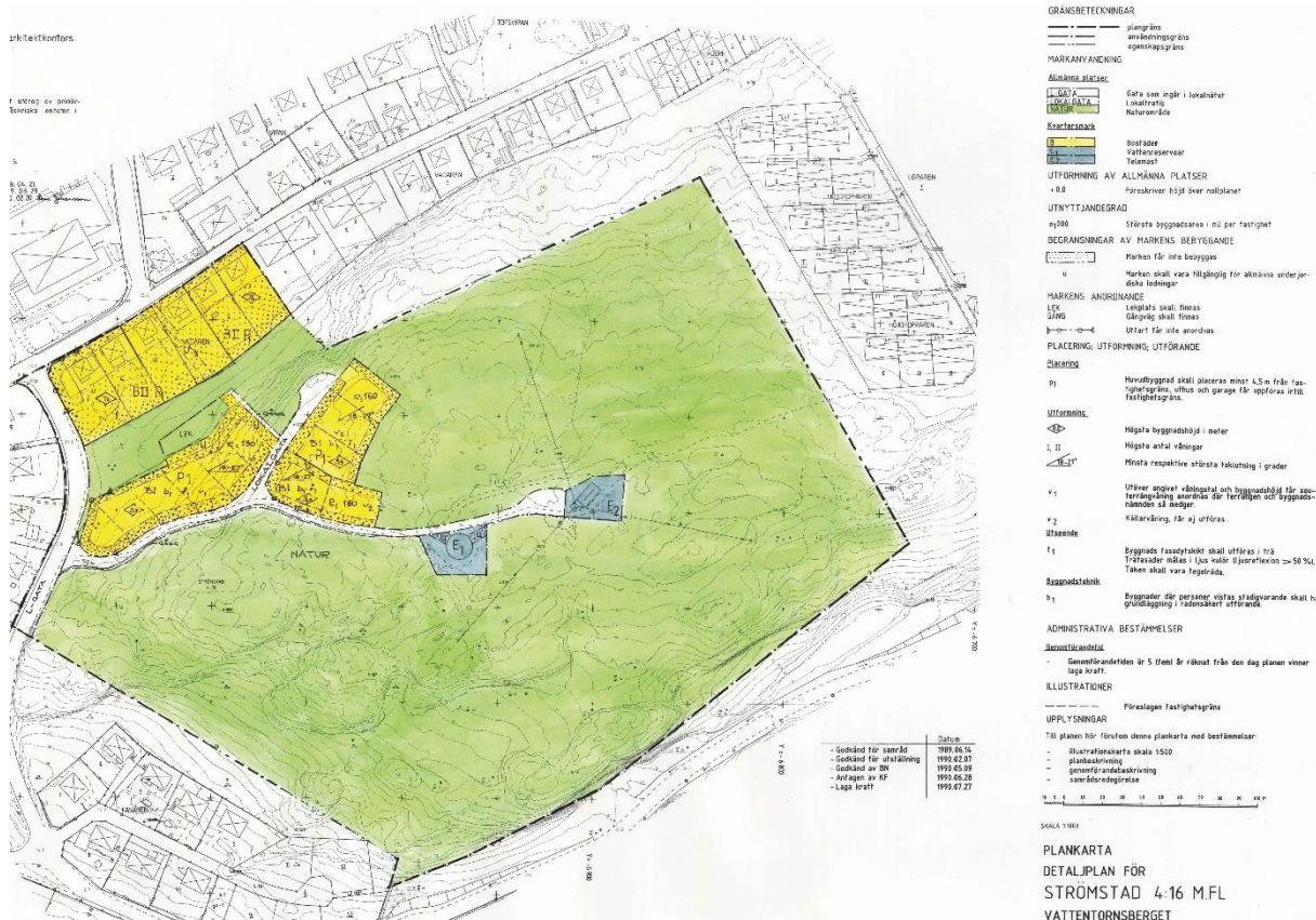
Plankarta, utklipp från gällande detaljplan.

Genomförandetiden är angiven till 5 år från den dag beslut om antagande vunnit laga kraft. Det finns således ingen pågående genomförandetid. Gällande detaljplan omfattas av äldre plan- och bygglagen (PBL 1987:10).