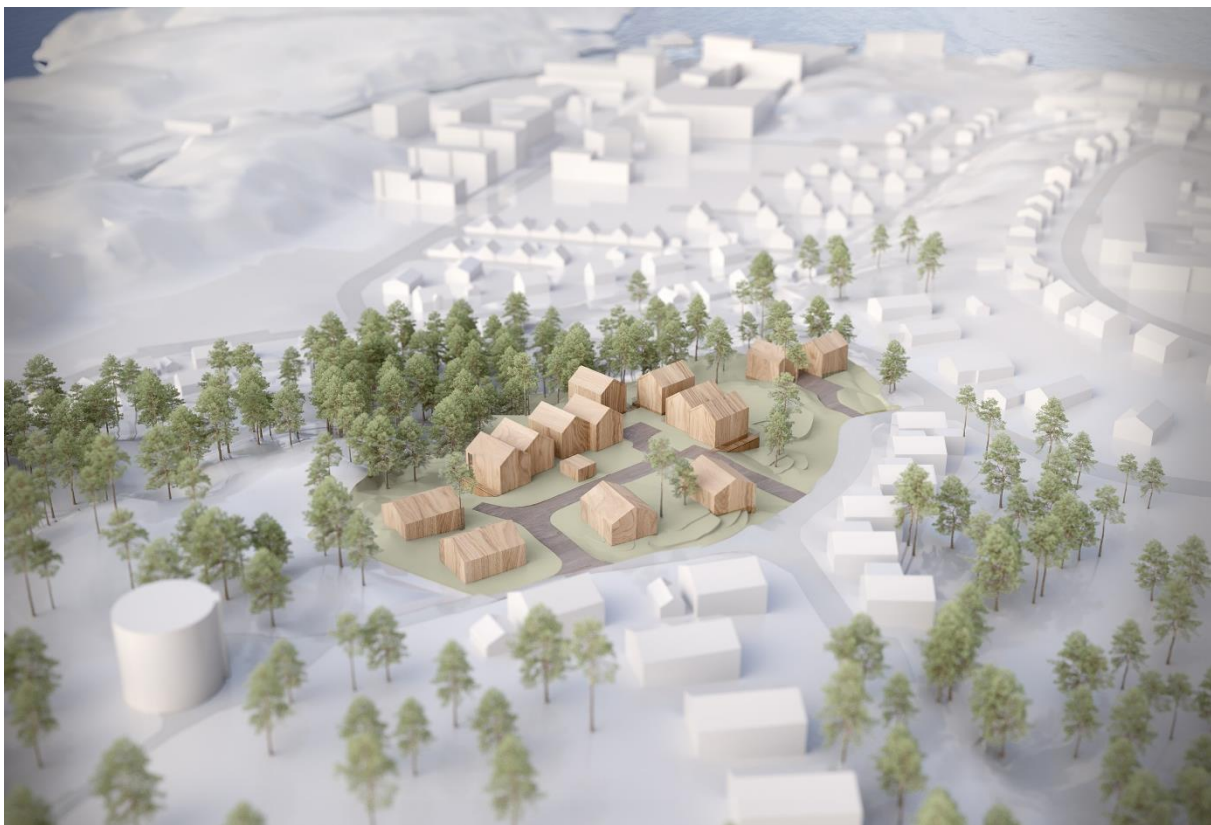
Modellskiss tillhörande parallellt pågående förslag för ny detaljplan i området, Liljewall.

Delar av gällande detaljplaneområde planeras att ersättas med detaljplan för del av Strömstad 4:16 m.fl. (Vattentornsberget) (dnr MBN-2019-451). Syftet med detaljplanen är att förtäta ett område i centrala Strömstad med bostäder i rad- eller parhus och friliggande hus. Tomterna i förslaget ska vara små och vara anpassade till befintlig terräng. Befintlig hållmark ska till stor del bevaras och allmänhetens tillgänglighet till kringliggande naturområden ska säkerställas. Planförslaget gick ut på samråd i slutet av 2023 (28 november – 20 december). Förslag till ny detaljplan och ändring av gällande detaljplan hanteras i två enskilda planprocesser och är oberoende av varandra. Händelseförlopp och utgång i ändringsförslaget bedöms inte påverka planförslaget för ny detaljplan i närområdet och vice versa.