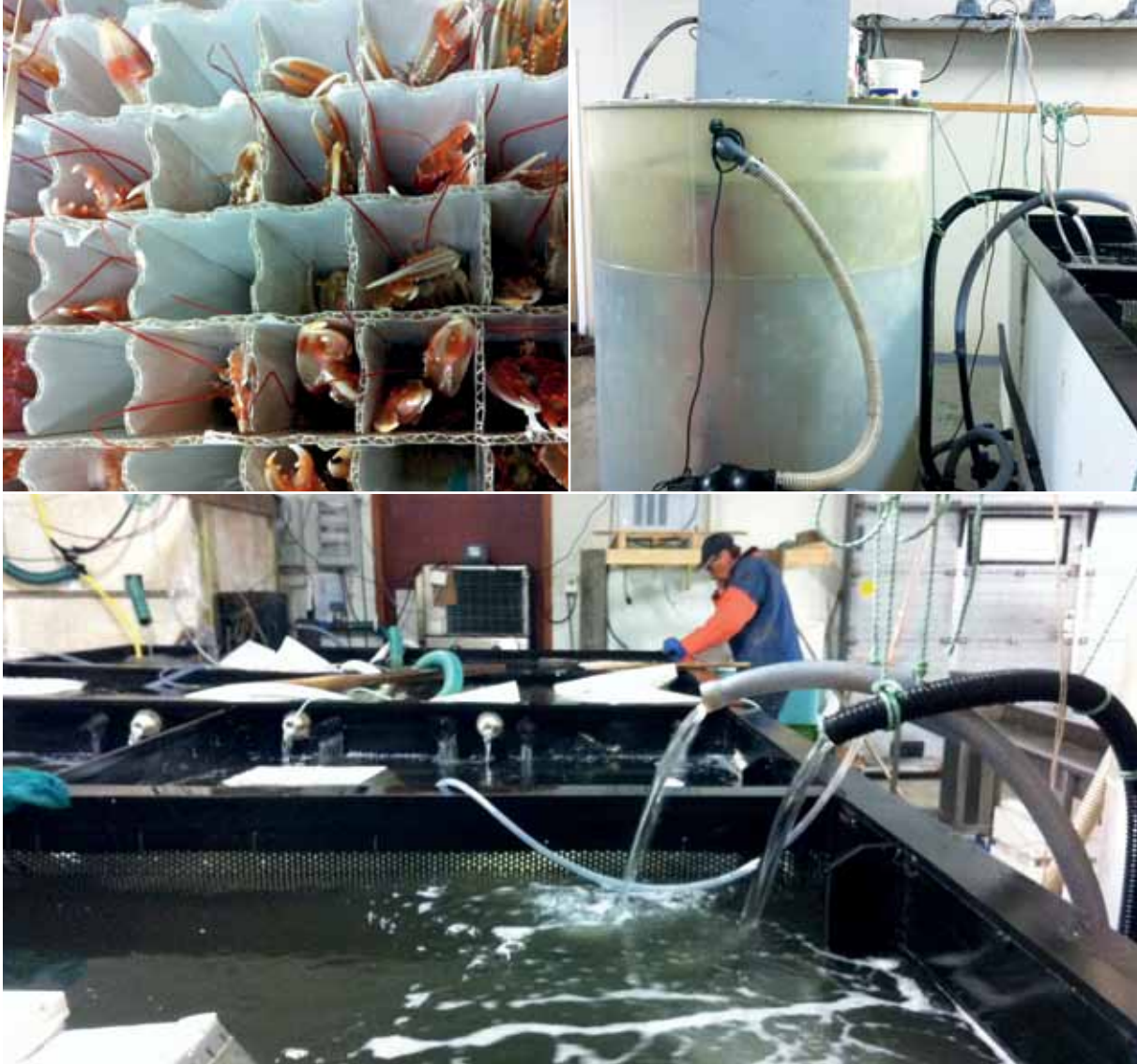
Företaget Kvalitetskräftan i Fjällbacka levererar förstklassiga kräftor som levandelagrats i flera veckor före leverans