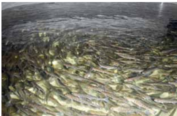
Ung regnbåge i ett landbaserat, slutet odlingssystem hos företaget EM Lax i Fengersfors.

Det finns lokala leverantörer av sättfisk. Exempel är EM Lax i Fengersfors (främst lax, regnbåge, öring) och Antens laxodling i Alingsås. Danska odlare kan tillhandahålla piggvar och i Norge finns en uppsjö av försäljare av sättfisk för olika arter. Tänk på att det finns särskilda bestämmelser för införsel av fisk från andra länder. Det är också viktigt att den aktuella arten inte avviker genetiskt från vilda bestånd i närheten. Länsstyrelsen kan informera om vad som gäller.