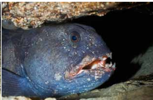
Havskatt – lovande odlingsart på västkusten.