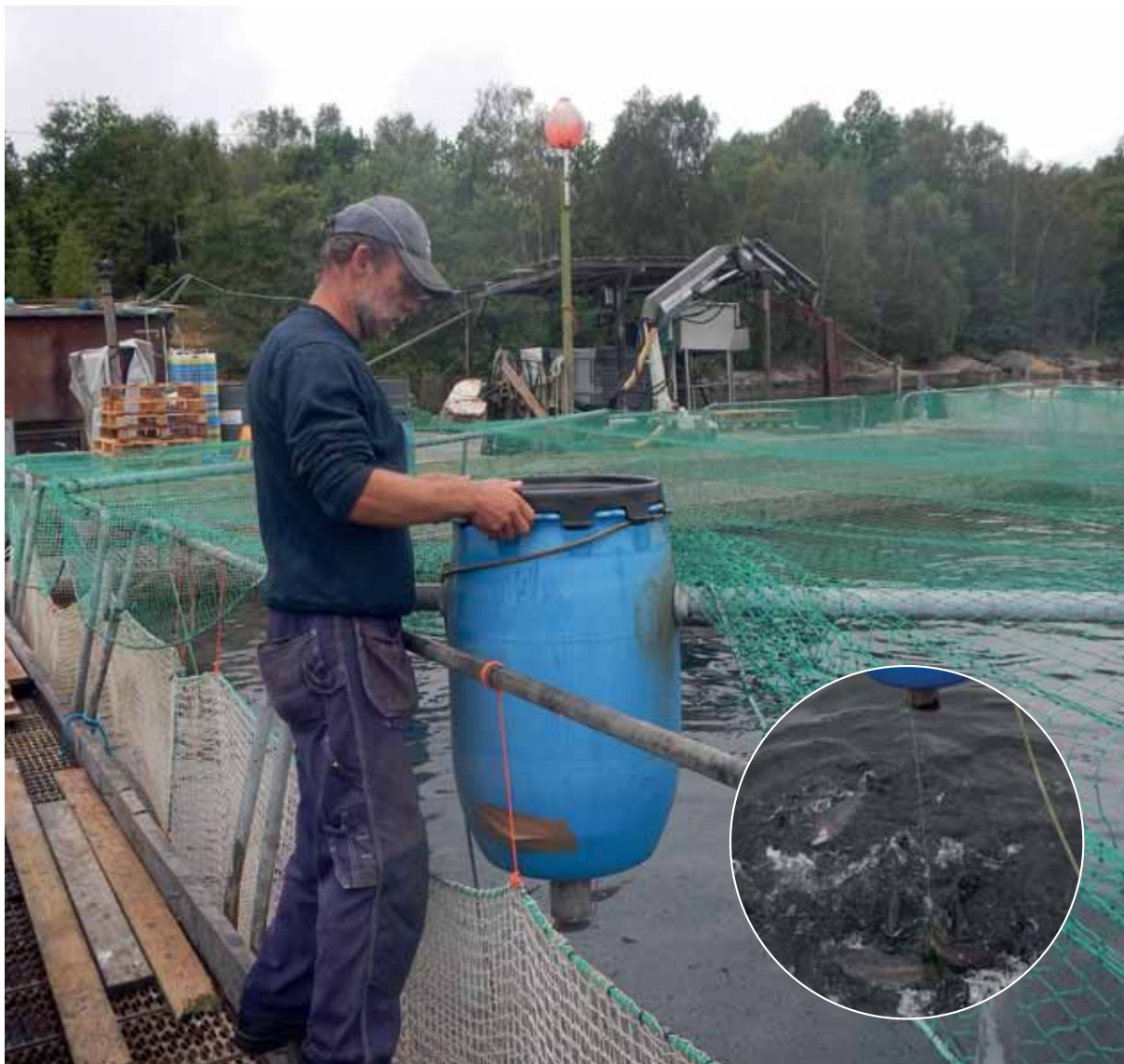
Matdax för regnbåge vid Tjärö Lax, Blekinge.