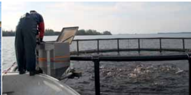
Odling av regnbåge i kassar i Fjärholm, Bohus-Björkö i Bohuslän och Tiraholm, Småland.