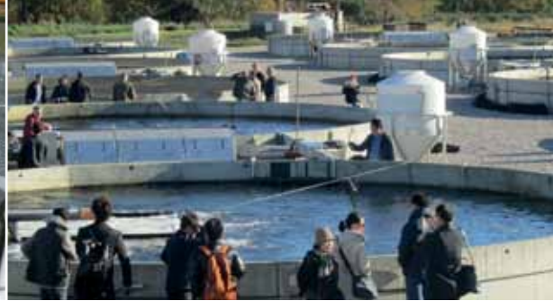
Lerkenfeldts öringfarm, Danmark.