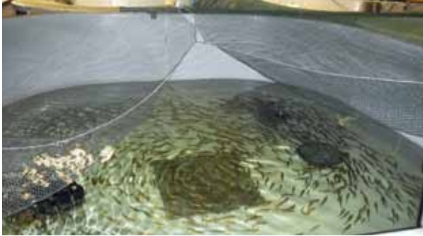
RAS-anläggning vid Mörrums Lax, Blekinge.