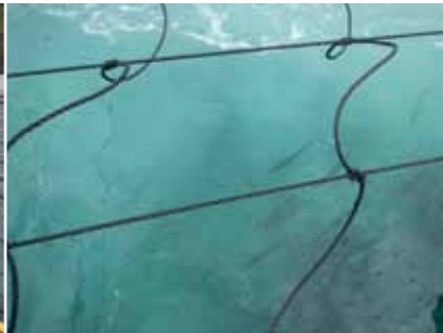
Semisluten odling i Norge.