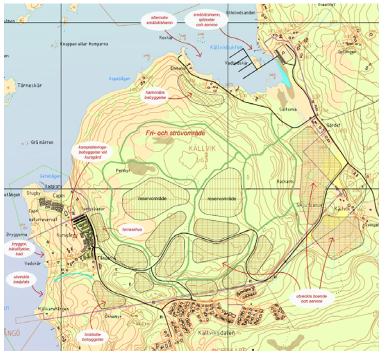
Skissförslag från Källviken AB över hela fastigheten