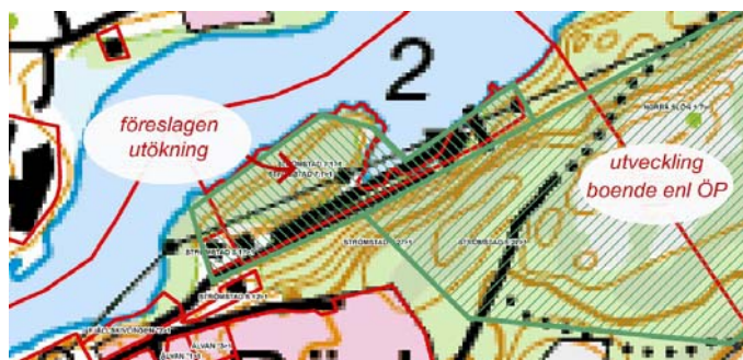
Utdrag ur kartbilaga till yttrandet

Undertecknade är ägare av fastigheten Strömstad 5:17. I översiktsplanen har markerats ett område för utveckling boende söder om Strömsvattnet. Strax till väster om området har vi vår fastighet Strömstad 5:17. Vi har också planer på att förvärva skjutbanetomten intill, Strömstad 7:1. Vi önskar att dessa fastigheter tas med i utvecklingsområdet.