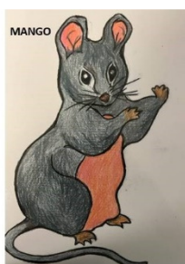
Valemyrsskolans maskot: Musen Mango M: Mångfald, Ansvar, Nyfikenhet, Gemenskap, Omtänksamhet