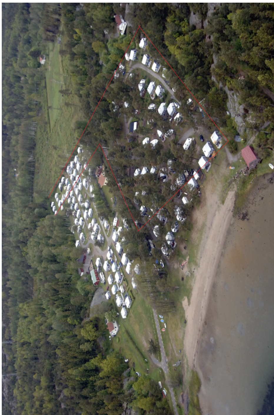
Nuvarande camping inom fastigheterna Kungbäck 1:21 och 1:22 samt ungefärlig markering för vilka campingplatser som kommer att tas bort.

Tillägget behandlar nya möjliga utvecklingar inom fastigheterna Kungbäck 1:21 och 1:22 samt de oförändrade detaljplaneförslagen för Kungbäck 1:59 och 1:144 och konsekvenser härav.