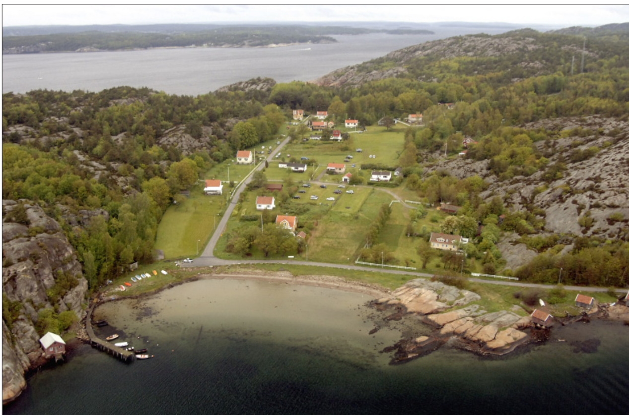
Överst: Ledsund i väster når man med båt eller via en naturstig över bergen. Nederst: Badviken väster om Kungsviks hamn.