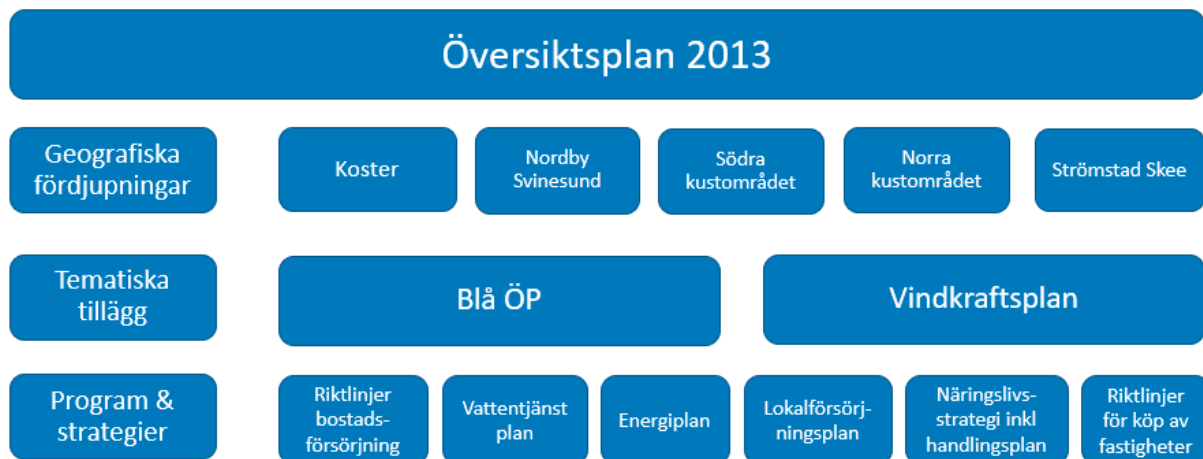
Bild 1. Översiktsplanepaketet

Den sammanfattande bedömningen är att översiktsplanen och dess fördjupningar i huvudsak är aktuell och kan utgöra grund för kommunens långsiktiga planering. Kommunen bedömer att det inte råder någon konflikt mellan kommunens översiktsplan och nya nationella och regionala mål och ställningstaganden. En ny översiktsplan behöver inte tas fram i dagsläget.