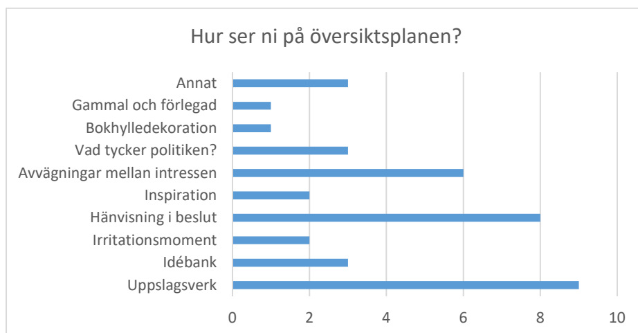
Tabell 1. Sammanställning av enkätsvar på frågan "Hur ser ni på översiktsplanen?"

På frågan om hur bra man anser att översiktsplanen vägleder i arbetet anger hälften av de svarande att det borde/kunde bli bättre vägledning, följt av tillräcklig och mycket bra vägledning. Ingen av de tillfrågade anger att översiktsplanen ger knappt användbar eller inte användbar vägledning.