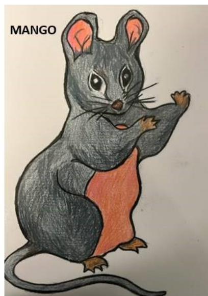
Valemyrsskolans maskot: Musen Mango

Elever och personal har tillsammans tagit fram en maskot för skolans värdegrund: Musen MANGO.