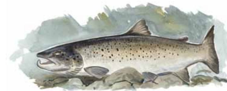
havsöring Salmo trutta

Havsöring lever större delen av sitt liv i havet. När den ska leka, vanligtvis på hösten, vandrar den upp i sötvatten. Under vandringen ändrar öringen färg, från silverfärgad till brunaktig och hanarna får en karakteristiskt utformad underkäskrok.