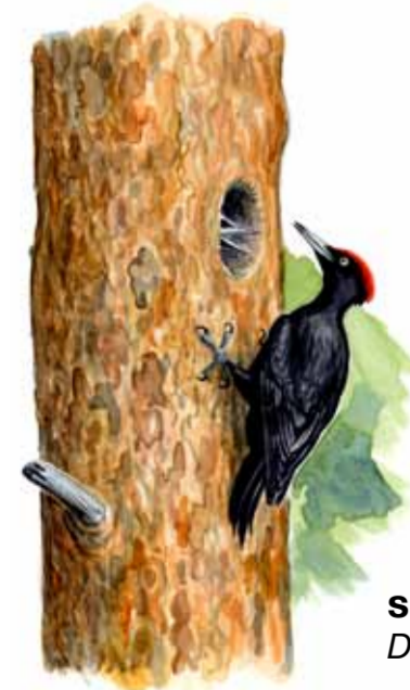
spillkråka Dryocopus martius

...och frodig ravin. Kontrasten är stor mellan de karga hållmarkerna och den fuktiga bäckravinen. Här frodas klibbal och andra lövträd tillsammans med gran. I den mullrika jorden trivs också växter som strutbräken, ormbär och vätteros. Ravinen är en ypperlig miljö för lavar, svampar och